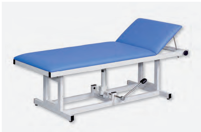
1 H-XXL 1080/Y