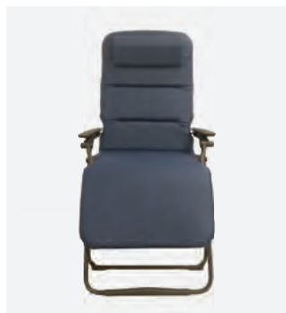
3 KL-1070/M, HRM-14/KL