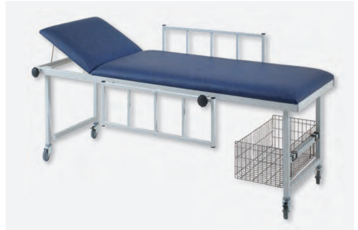
2 AWL-1065, Korb