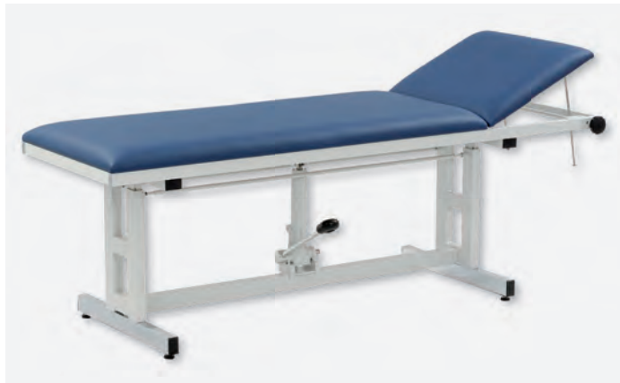
1 H-U 1065/Y

Eine andere Art der Höhenverstellung bietet die Hydraulik. Diese wird durch die zentral eingebaute Fußpumpe bedient. Die Höhenverstellung kann selbstverständlich auch mit schweren Patienten (bis zu 200 kg), ohne großen Kraftaufwand, erfolgen. Die Montage des Fußhebels ist auf der linken bzw. rechten Seite möglich. Gegen Aufpreis ist ein zweiter Fußhebel erhältlich.