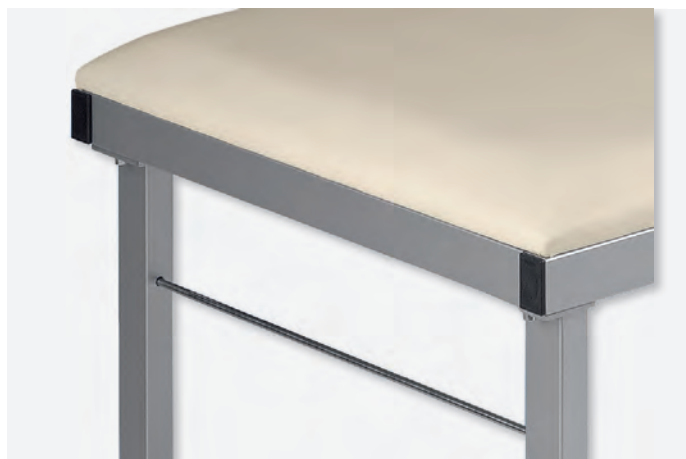
3 XXL-1080/1900/PH - Detail