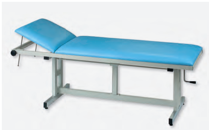
1 H-U 1065/H

Wer eine Universalliege sucht, die nur ab und an in der Höhe verstellt werden soll, dem empfehlen wir die Anschaffung einer Universalliege mit Handkurbelhöhenverstellmechanismus. Die Bedienung der Handkurbel, bei dieser preisbewussten Ausführung einer höhenverstellbaren Liege, erfolgt vom Fußende aus. Nach der Benutzung wird die Handkurbel einfach nur wieder unter die Liegefläche geschoben.