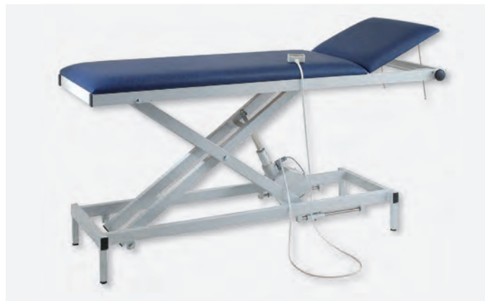
2 H-U 1065/E 930