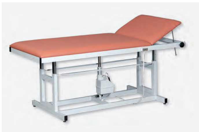
2 H-XXL 1080/E