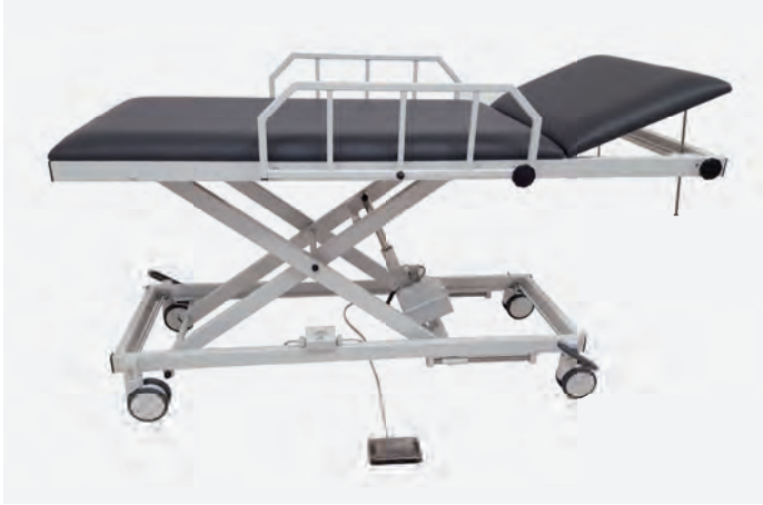
1 H-AWL 1080/E 930

Wir haben unser Lieferprogramm der Aufwach-/Patiententransportliegen um elektromotorisch höhenverstellbare und Akku angetriebene Varianten erweitert. Auch diese Liegen sind standardmäßig mit Laufrollen in Form einer Zentralverstellung und zwei Seitengittern erhältlich.