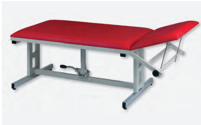
2 H-SU 1080/Y