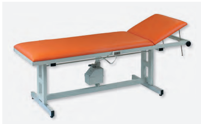
1 H-U 1065/E

Die hier gezeigten Modelle sind in verschiedenen Gestellausführungen, Breiten und Verstellmöglichkeiten für den Kopfteil erhältlich.