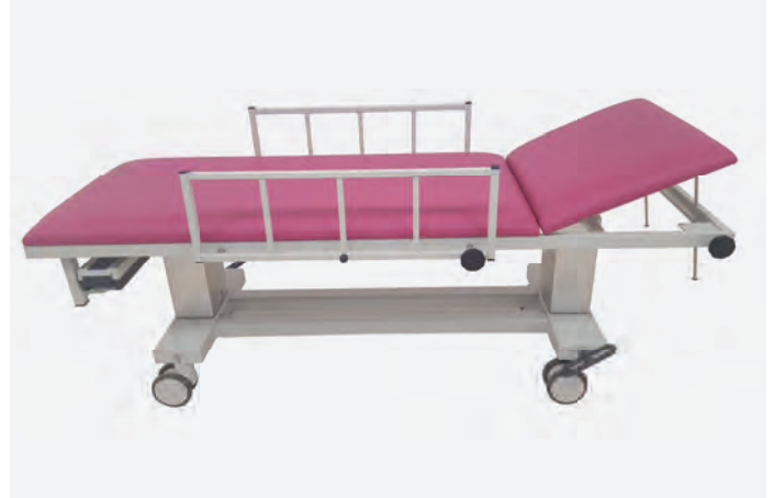
2 H-AWL 1065/AC 1070