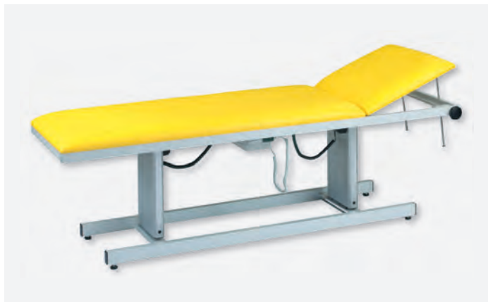
1 H-U 1065/EE 850

Sie sind in drei Rahmenbeschaffenheiten (Lack, Chrom, Edelstahl) und zwei Breiten (650, 800 mm) verfügbar.