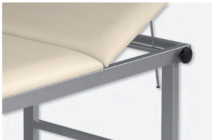
2 XXL-1080/1900/PH - Detail