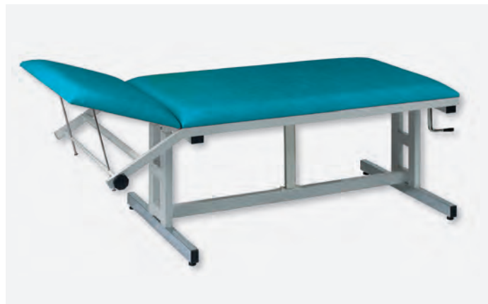
2 H-SU 1080/H