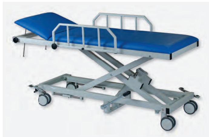
2 H-AWL 1065/Y 980