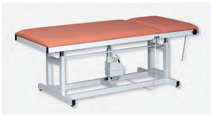
3 H-XXL 1080/E