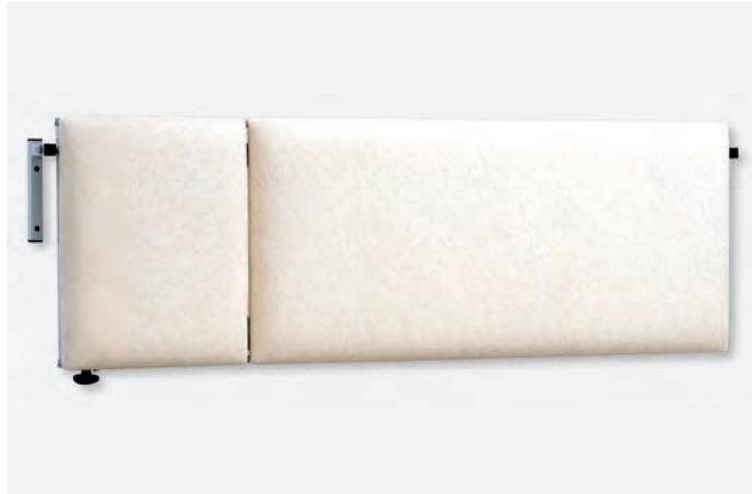
2 WKL-1065, Kopfteil links