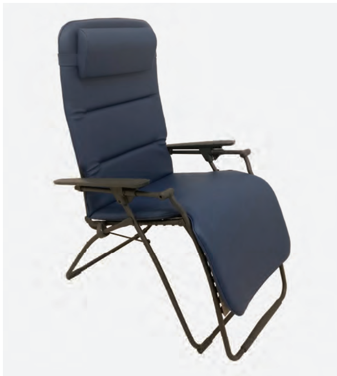
1 KL-1070/M, HRM-14/KL

Die Ruheliege wird als Entspannungs- bzw. Ruhesessel oder als EEG-Stuhl eingesetzt. Das Elektro-Enzephalogramm (kurz EEG) ist eine Methode der medizinischen Diagnostik und der neurologischen Forschung. Es ist eine völlig risikolose Untersuchungsmethode zur Messung von Hirnstromwellen.