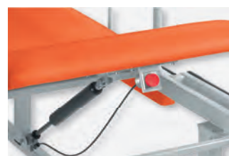
3 PTL-1070/LRZ - Detail