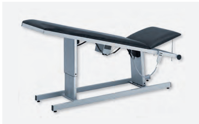
2 H-U 1065/EE 850