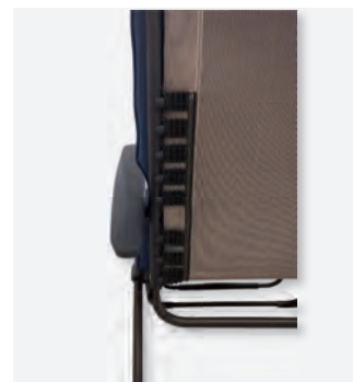
4 KL-1070/M - Detail