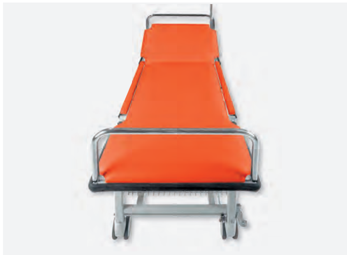
2 PTL-1070/LRZ, INF-30170, Korb