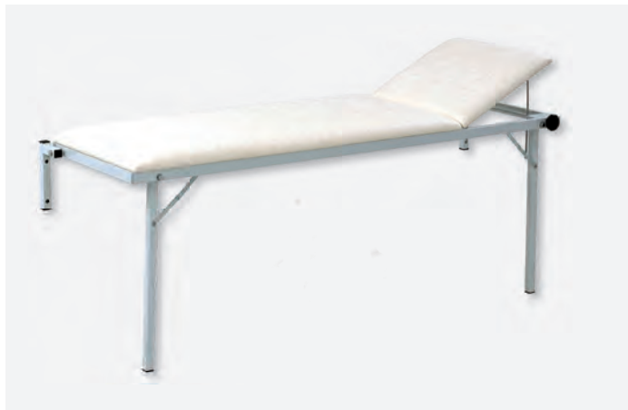
1 WKL-1065, Kopfteil rechts

Die Wandklappliegen finden dort ihren Einsatz, wo eine permanent aufgebaute Liege nicht benötigt wird. Sie zeichnen sich durch ihre extrem kurze Aufbauzeit und sofortige Nutzung aus. Die Wandklappliegen sind in drei Gestellbeschaffenheiten (Lack, Chrom, Edelstahl) und zwei Breiten (650, 800 mm) lieferbar.