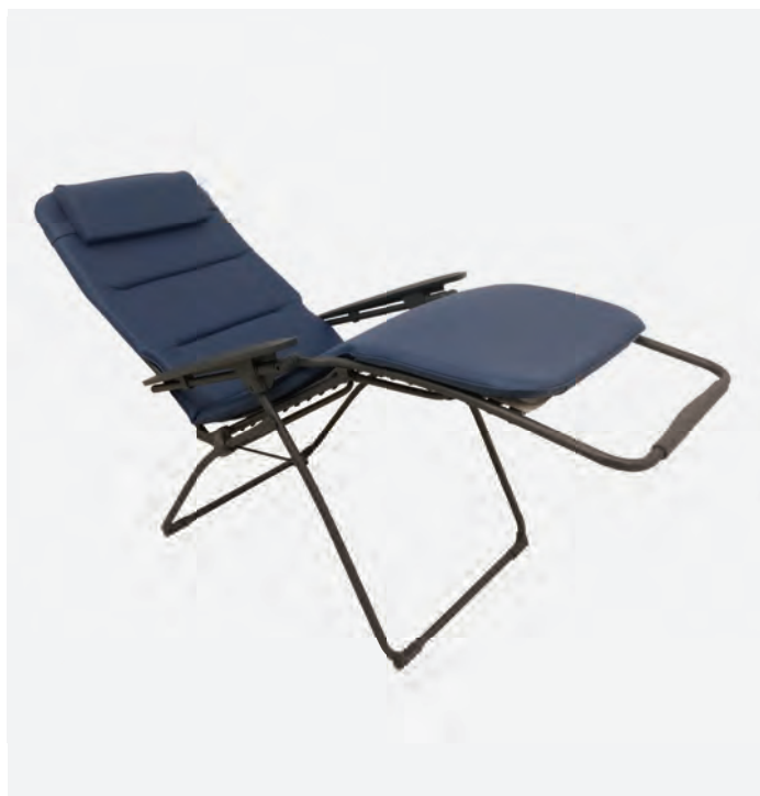
2 KL-1070/M, HRM-14/KL