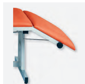
3 H-SU 1065/E - Detail