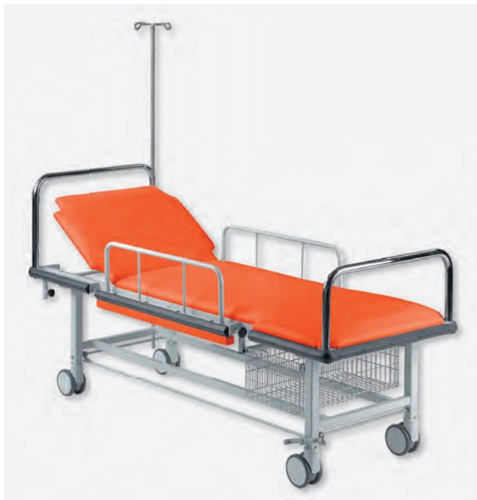
1 PTL-1070/LRZ, INF-30170, Korb