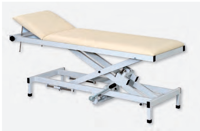
1 H-U 1065/Y 980

Die hydraulisch höhenverstellbaren Universalliegen mit Scherenmechanismus, zeichnen sich durch ihren besonders großen Verstellbereich aus. Die hydraulische Höhenverstellung (500-980 mm) erfolgt per Fußpumpe. Die Montage des Fußhebels ist auf der linken bzw. rechten Seite möglich.