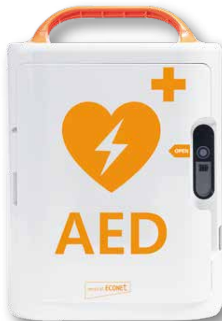
ECO-AED - Der kosteneffektivste AED. ECO-AED - The most cost-effective AED.